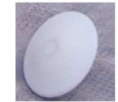
Clou rond Simple en Plastique VISIBLE DE NUIT BLANC - JAUNE