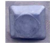
Clou carré en aluminium Simple