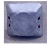
Clou carré en aluminium à 4 billes Réfléchissantes