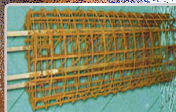
● Treillis à souder