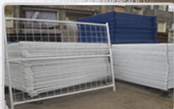
● Panneaux treillis à souder