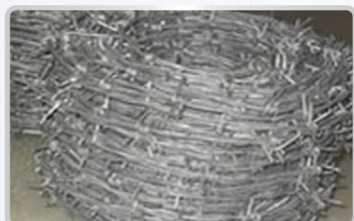
● Bobine barbelé